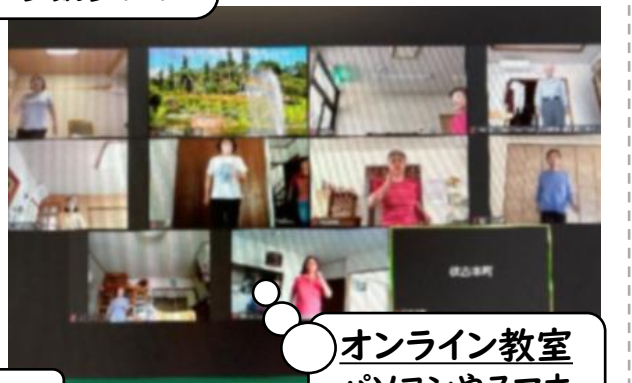
オンライン教室 パソコンやスマホから体操に参加!