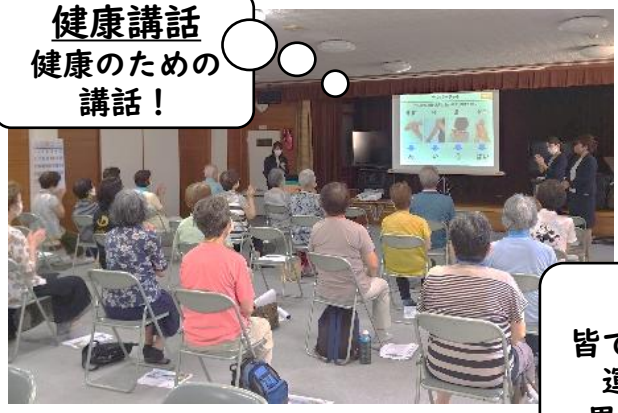
健康講話 健康のための講話!

閉じこもり予防、転倒予防、認知症予防、栄養改善、口腔機能向上等をテーマに、講話や運動、レクリエーション、創作活動等を行っています。