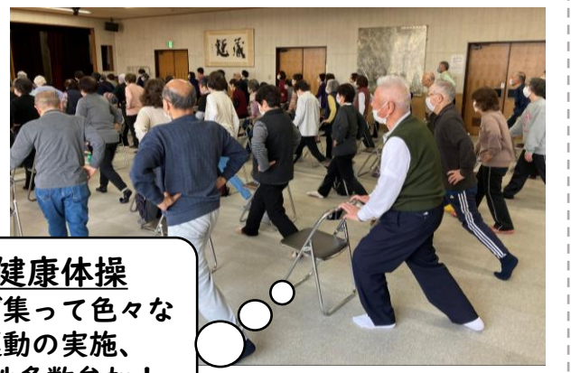
健康体操 皆で集って色々な運動の実施、男性多数参加!