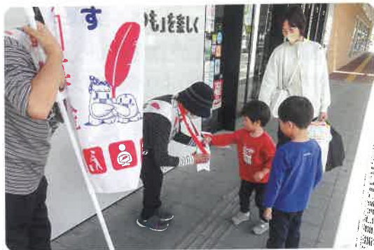
募金のご協力ありがとうございました