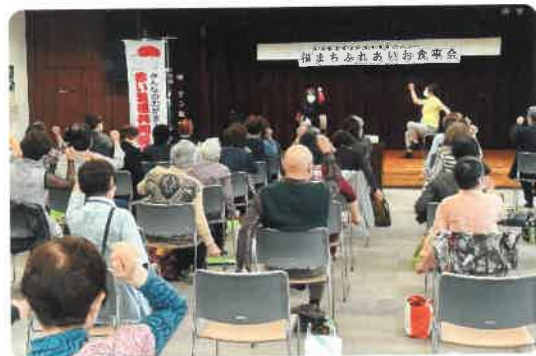
栄東地区・福まちふれあいお食事会