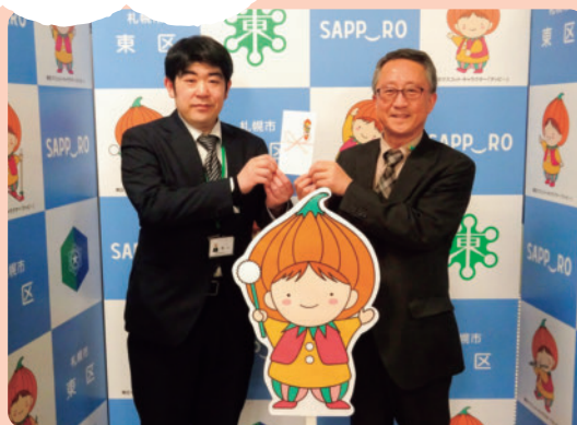
イトーヨーカドー労働組合 札幌支部 様

皆様から頂いた善意は、地域の福祉活動（地域の見守り活動や孤立をしない地域づくり）に活用させていただいております。皆様からのお申し込みをお待ちしております。