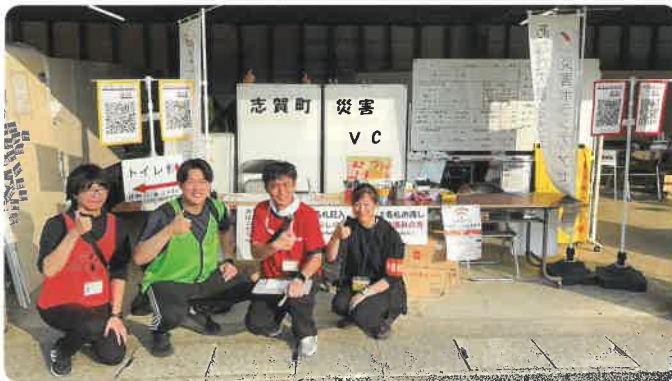
全国各地から社協職員が応援に駆け付けます

東区社協としても、現地で得た経験を共有し、札幌市や東区で災害が起きた場合に備えて、組織一体で取り組んでまいります。