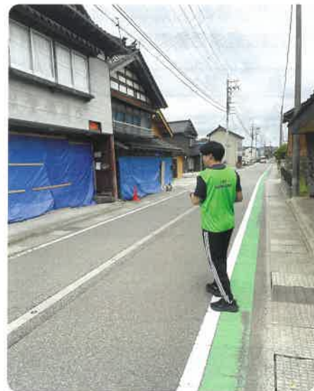
被災した家屋を現地調査