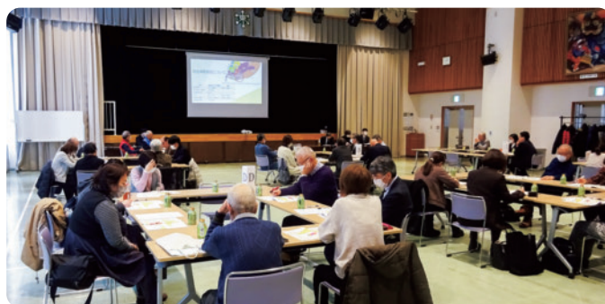
東区福祉のまち推進センター全体研修会(令和6年2月26日)