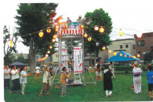
伏古本町地区 世代間交流盆踊り