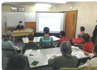
さくら会様で開催した出張講座の様子

※詳細は東区社会福祉協議会（TEL:741-6440）までお問い合わせください。