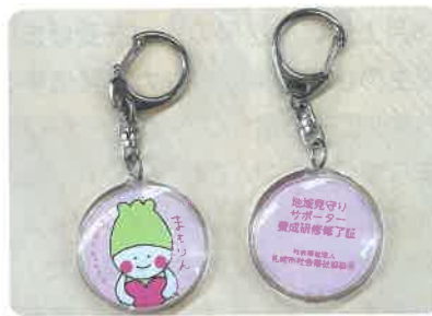
受講された方には、修了証（まもりんキーホルダー）をお渡ししています。