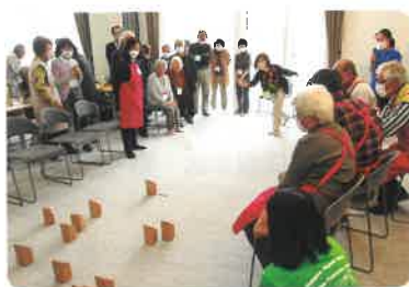
モルックで大盛り上がり!

札幌地区福まちでは、福まちサロン以外にも親子の対象とした交流の場「子育てふれあい広場」を開催しています。これからも住民同士のつながりを大切に、誰もが安心して暮らせる地域づくりに向け、取り組みを進めていきます。