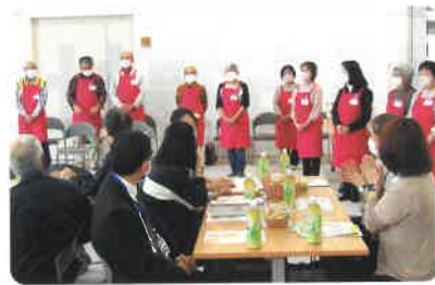
福まちメンバーは、おそろいのエプロンが目印! みなさんの参加をお待ちしています。