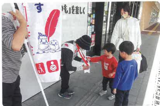
募金のご協力ありがとうございました