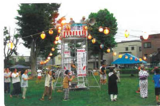
伏古本町地区 世代間交流盆踊り